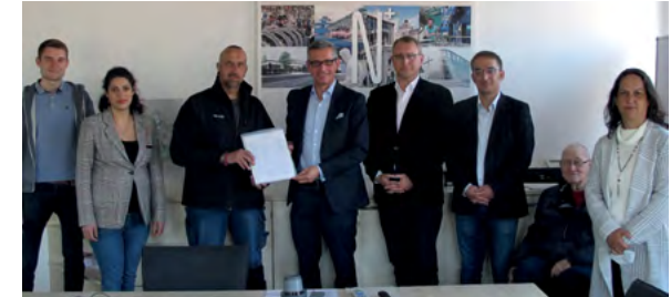
Unterschriftenübergabe im Wirtschaftsraithaus am 04.05.22

Nachdem die Norma im Einkaufszentrum an der Bonhoefferstraße im letzten Sommer geschlossen werden musste, wurde der Supermarkt schmerzlich vermisst. Eine reine Wohnbebauung, wie es angeblich geplant war, wird hier abgelehnt.