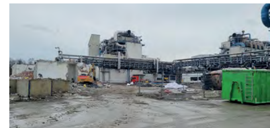
Abrissarbeiten an der Breslauer Straße im März 2022