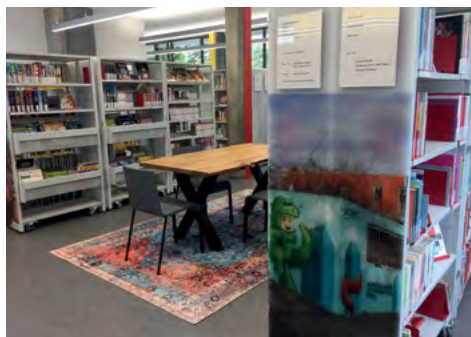
Die neuen Räumlichkeiten mit Fotowand

Hilfe! Hilfe! Hier bei uns sind kleine Geister und sie essen gerne Kleister, lasst uns zusammen was Schönes kleben und gemeinsam Halloween erleben, und zwar am Donnerstag, 27.10., 15 bis 16:30 Uhr