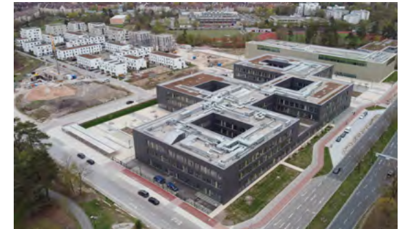
Luftbild des neuen Schulzentrums vor Langwasser T

Am 30. Mai wurde das neue Schulzentrum nach dreijähriger Bauzeit termingerecht eingeweiht.